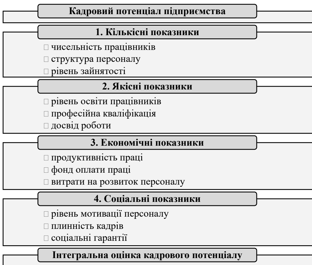
Рис. 2. Система оцінювання кадрового потенціалу аграрного підприємства Примітка. Сформовано автором

Для оцінювання соціальної відповідальності та рівня кадрового забезпечення аграрних підприємств доцільно використовувати систему показників, що охоплюють економічні, соціальні та організаційні аспекти діяльності підприємств [6]. До таких показників можна віднести рівень оплати праці, рівень зайнятості працівників, показники продуктивності праці, рівень соціальних гарантій та інвестиції у розвиток людського капіталу.