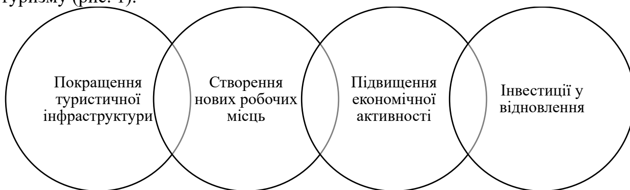
Рис. 1. Вплив інсайт-туроперейтингу на відновлення інфраструктури та економіки постраждалих регіонів*

Інсайт-туроперейтинг має значний вплив на відновлення інфраструктури та економіки постраждалих регіонів України, оскільки він сприяє залученню інвестицій і відновленню місцевих підприємств через розвиток внутрішнього туризму (рис. 1).