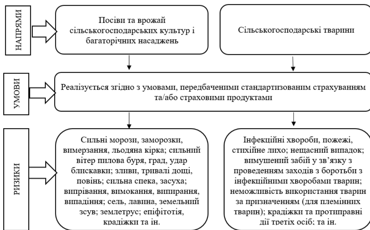
Рис. 2. Агрострахування: напрями, умови та ризики [3]

Таким чином, оголошення воєнного стану суттєво вплинуло на функціонування сільськогосподарського страхування в Україні. Форс-мажорні обставини трапляються і на ринку агрострахування, тому війна зазвичай посідає перше місце в цьому списку [7].