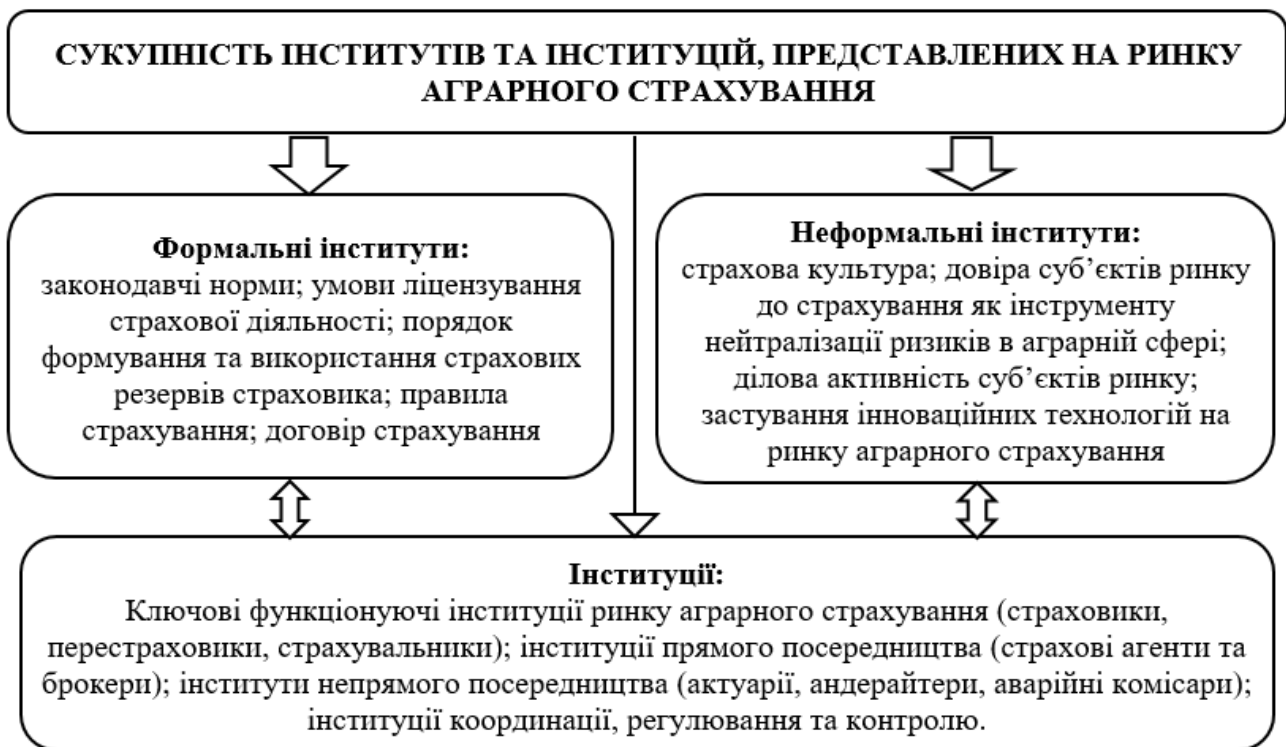
Рис. 1. Розподіл інститутів та інституцій за функціональними ознаками відповідно до потреб розвитку ринку аграрного страхування

Інституціоналізація страхового процесу також неможлива без функціонування інститутів, які складаються з групи осіб, які впливають один на одного і створюють необхідні умови для виконання певних правил і стандартів, встановлених системою ринку сільськогосподарського страхування.