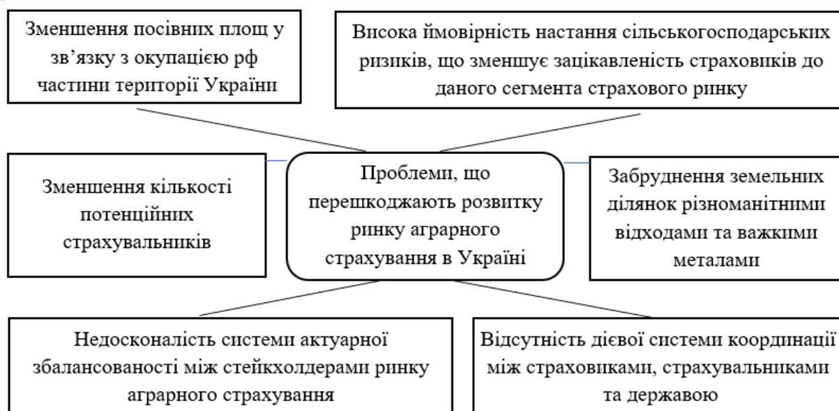
Рис. 4. Проблеми, що перешкоджають розвитку ринку аграрного страхування в Україні

Тим не менш, немає сумнівів, що вітчизняний ринок агрострахування має потенціал для розвитку. У той же час, необхідно підкреслити основні проблеми, які стримують можливості подальшого розвитку українського ринку агрострахування (рис. 4).