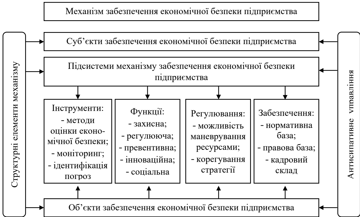
Рис. 2. Механізм забезпечення економічної безпеки підприємства [5, с. 67]

Суб'єктами механізму забезпечення економічної безпеки підприємства є особи, служби і підрозділи, які відповідають за рівень економічної безпеки. Перелік суб'єктів механізму забезпечення економічної безпеки індивідуальний для кожного суб'єкта господарювання та визначається статутними документами, організаційною структурою та штатним розписом.