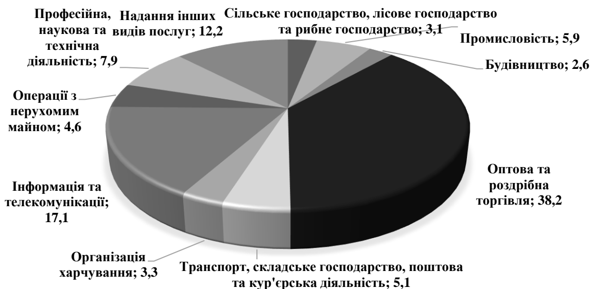
Рис. 1 Кількість діючих суб'єктів господарювання за видами економічної діяльності у 2022 році, % [2]

Будівництво і транспорт розвиваються на фоні економічного зростання та урбанізації, тоді як інформаційні технології демонструють бурхливий ріст завдяки інноваціям та глобальному попиту на цифрові послуги. Ці тенденції підкреслюють важливість адаптації підприємств до змін ринкових умов та використання новітніх технологій для підвищення їх конкурентоспроможності.