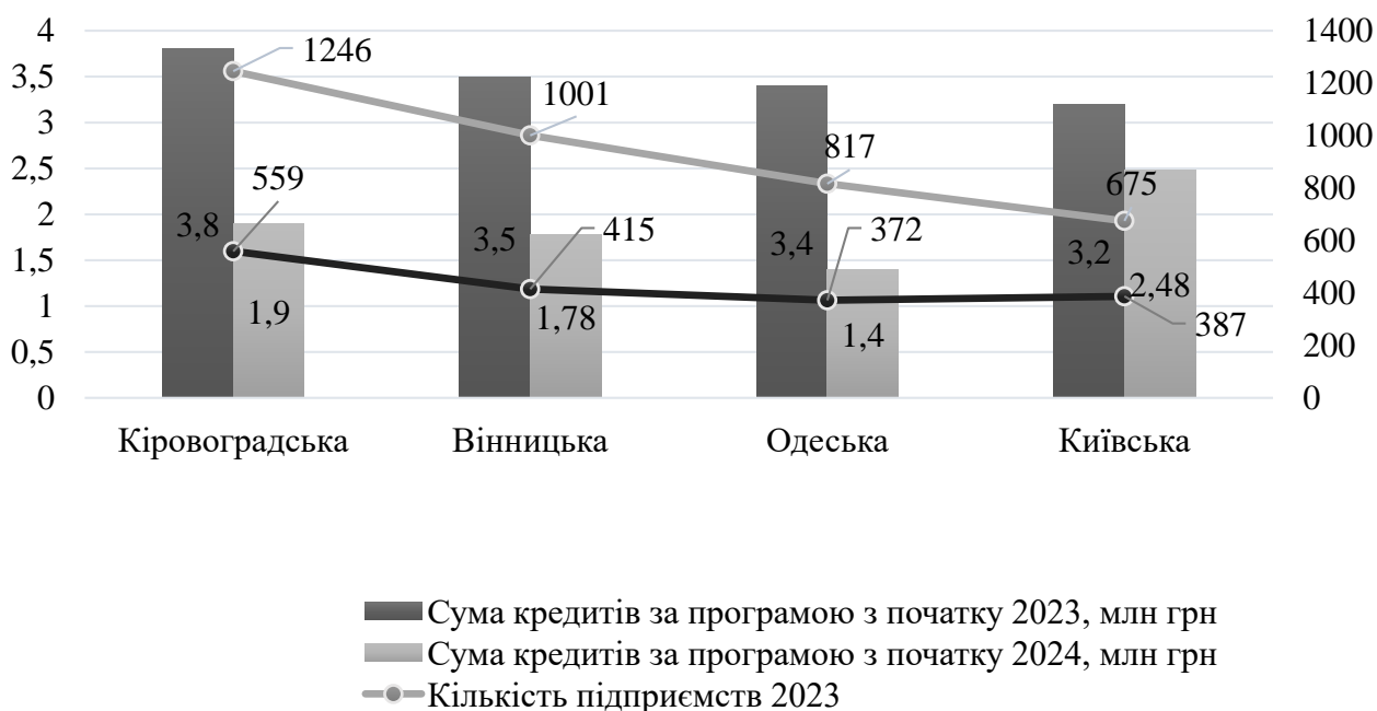
Рис. 2. Рейтинг областей за кредитами за державною програмою «Доступні кредити 5–7–9» з початку 2023 [8, 10]

За даними Міністерства аграрної політики, з початку 2023 року близько 11,3 тис. українських фермерів отримали банківські кредити на 58,8 млрд гривень на розвиток фермерських господарств, з яких понад 34 млрд гривень залучили 8,8 тис. підприємств в рамках державної програми «Доступні кредити 5-7-9». За програмою «Доступні кредити 5-7-9» більше всього отримали підприємства Кіровоградської, Вінницької, Одеської та Київської областей [8]. Проте, станом на 24.05.2024, 6970 аграрних господарств уже отримали 45,6 млрд гривень кредитів на розвиток. З них за державною програмою «Доступні кредити 5-7-9» – профінансовано 4170 господарств на 19,3 млрд гривень. Найбільше отримали підприємства Київської, Кіровоградської й Вінницької областей (рис. 2) [10].