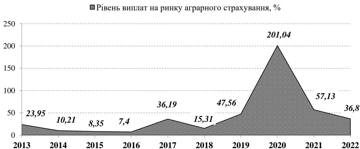
Рис. 5. Рівень виплат на ринку аграрного страхування за 2013-2022 рр., % Джерело: https://forinsurer.com/ (розраховано, побудовано та представлено авторами).

Показник рівня страхових виплат (відсоткове відображення відношення розміру виплат до розміру премій) в загальному розрізі страхових організацій, що надають послуги з аграрного страхування за 2013–2022 рр. розраховано та представлено на рис. 5.