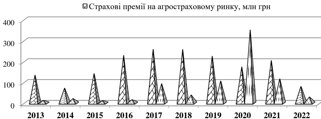
Рис. 4. Страхові премії та виплати на ринку аграрного страхування України за 2013-2022 рр., млн грн

Розмір страхових премій та виплат на агростраховому ринку України за 2013–2022 рр. відображено на рис. 4.