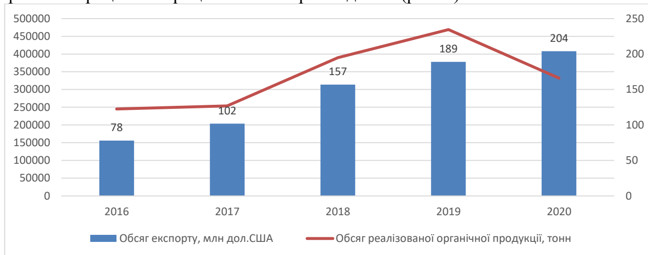
Рис. 1. Динаміка зміни обсягу експорту органічної продукції в Україні

Інтенсивний ріст експорту органічних продуктів почався з 2015 року на фоні інтеграційних процесів нашої країни до ЄС (рис. 1).