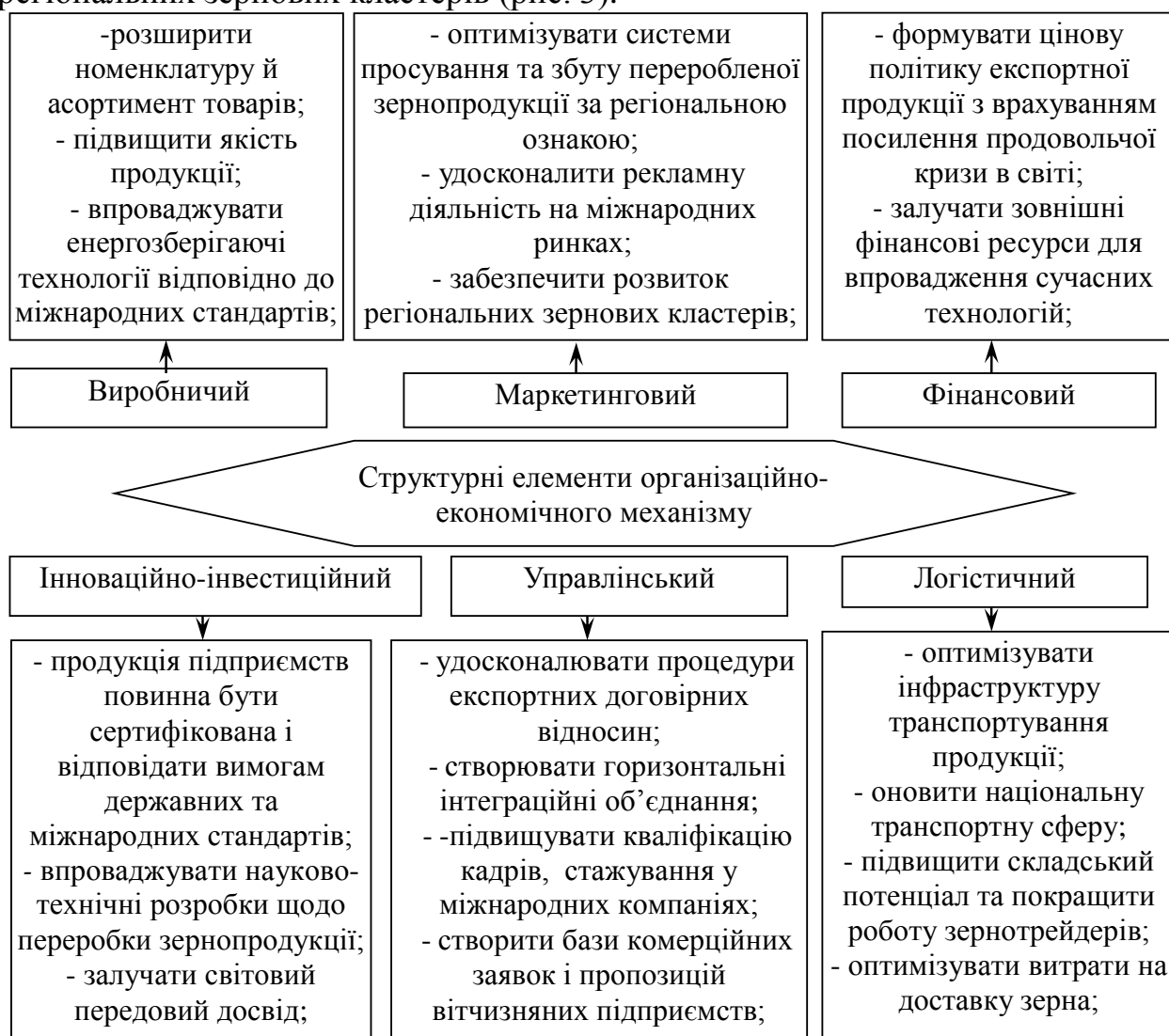
Рис. 4. Організаційно-економічний механізм нарощування експортного потенціалу зернопродуктової галузі України*

На нашу думку, більш перспективним, є створення горизонтальних інтеграційних об'єднань – маркетингово-збутових кооперативів та розвиток регіональних зернових кластерів (рис. 3).