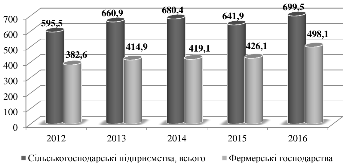
Рис. 2. Динаміка виробництва сільськогосподарської продукції в Україні у постійних цінах 2010р. на 100 га сільськогосподарських угідь, тис грн.