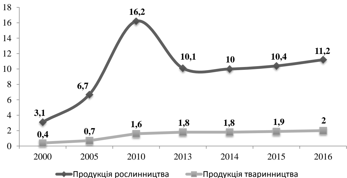
Рис. 4. Частка фермерських господарств у виробництві продукції сільського господарства у постійних цінах 2010 р., %

Результати дослідження свідчать, що фермерські господарства здебільшого спеціалізуються на вирощуванні рослинницької продукції. Частка фермерських господарств у виробництві сільськогосподарської продукції до всіх суб'єктів господарювання аграрної галузі незначна. У 2000 р. частка продукції рослинництва, виробленої фермерськими господарствами, в загальній структурі становила 3,1 %, а продукції тваринництва – 0,4 % (рис. 3).