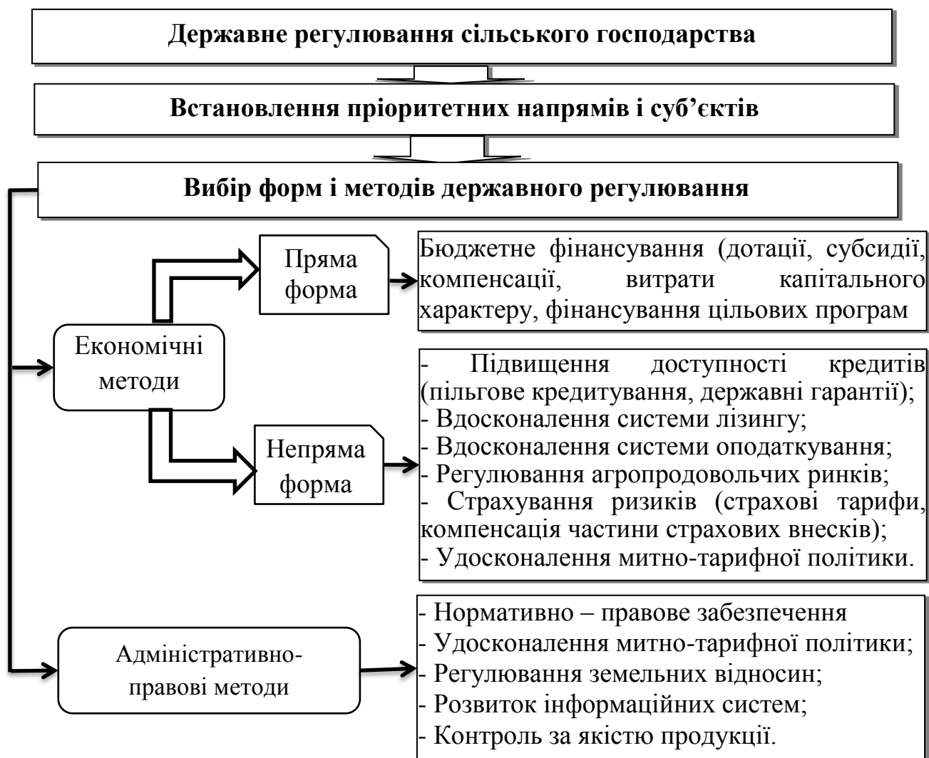
Рис. 3. Система державного регулювання сільського господарства

Нині першорядне значення в системі державного регулювання сільського господарства має кредитування. Аналіз і узагальнення наукових поглядів з питання удосконалення кредитування аграріїв, розширення їх доступу до кредитних ресурсів можливий за умов збалансованого поєднання всіх елементів системи економічного регулювання на підставі оптимального співвідношення державного регулювання економіки та ринкового саморегулювання, що відповідає вимогам ринку, здатного вирішувати соціальні завдання й взаємоузгоджувати інтереси держави і товаровиробників.