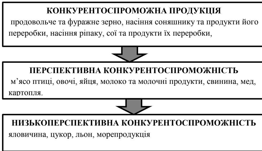
Рис. 1. Групи сільськогосподарської продукції за рівнем її конкурентоспроможності [9].

деякі з груп за рівнем її конкурентоспроможності сільськогосподарської продукції як: (рис. 1).