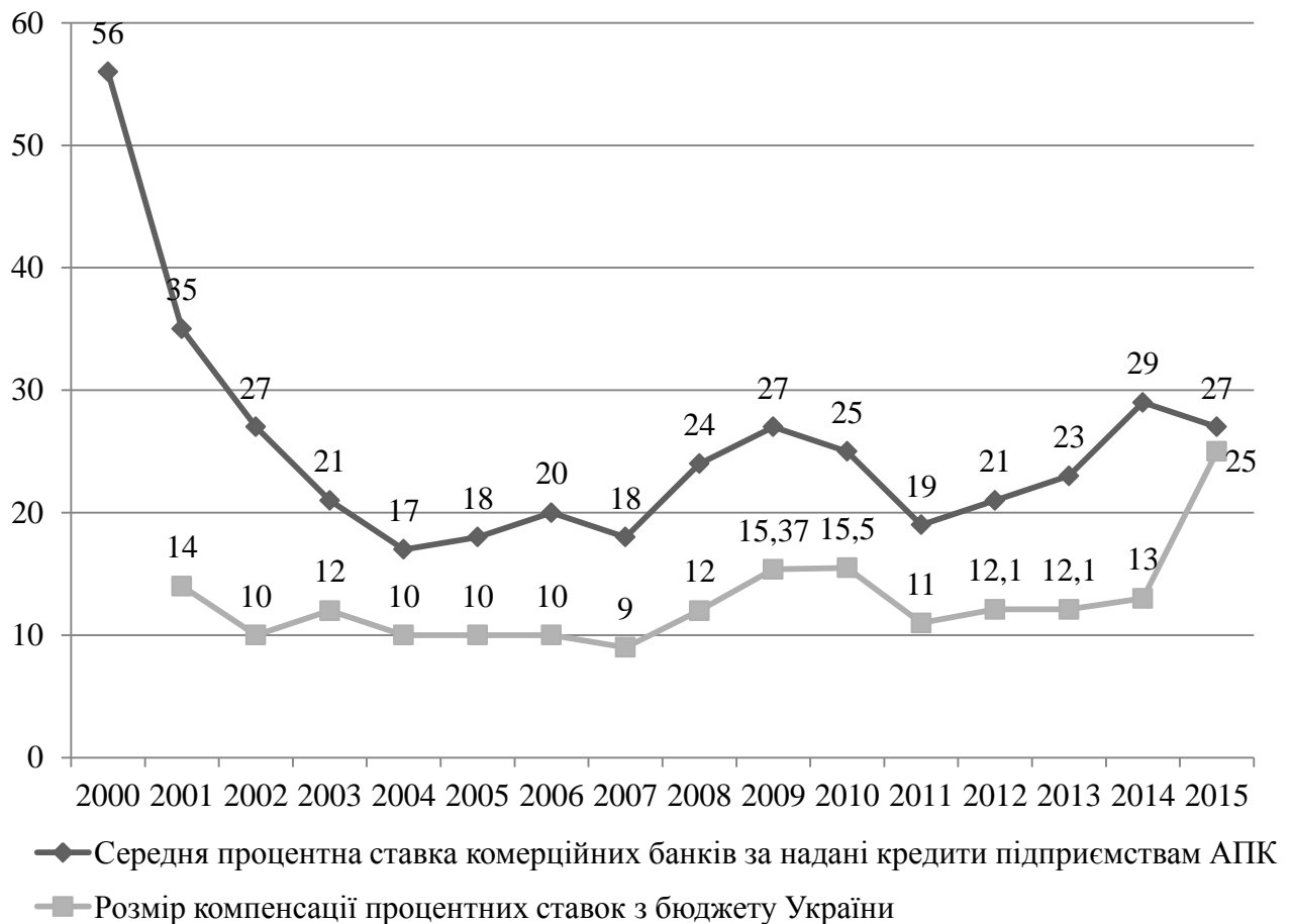
Рис. 2. Рівень відсоткових ставок комерційних банків України за надані кредити підприємствам аграрної сфери у національній валюті, %

області – у 3,2 рази, або на 138,0 млн.грн., Львівській області – у 3рази, або на 73,4 млн.грн., Київській області – у 2,4 рази, або на 1052,5 млн.грн., Одеській області – у 2,3 рази, або на 3004,6 млн.грн. [4].