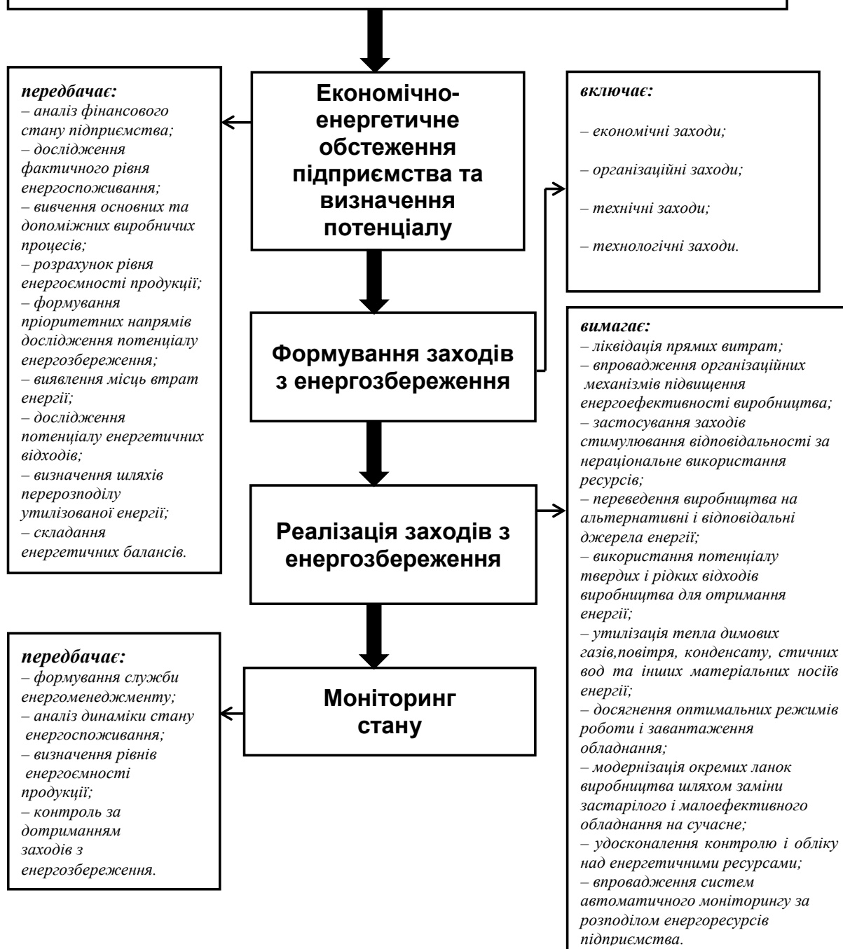
Рис. 2. Концептуальна модель організаційно-економічного механізму забезпечення енергоефективності сільськогосподарського підприємства

Висновки. 1. На основі проведеного теоретико-методологічного аналізу розкрито сутність механізму енергозбереження, встановлено його складність та багатогранність, що характеризується сукупністю форм, методів, елементів, способів взаємодії та важелів стимулювання, спрямованих на підвищення ефективності енерговикористання. Механізм енергозбереження складається з сукупності заходів, що забезпечують максимально-ефективне використання енергетичного потенціалу при мінімальних питомих витратах енергії на