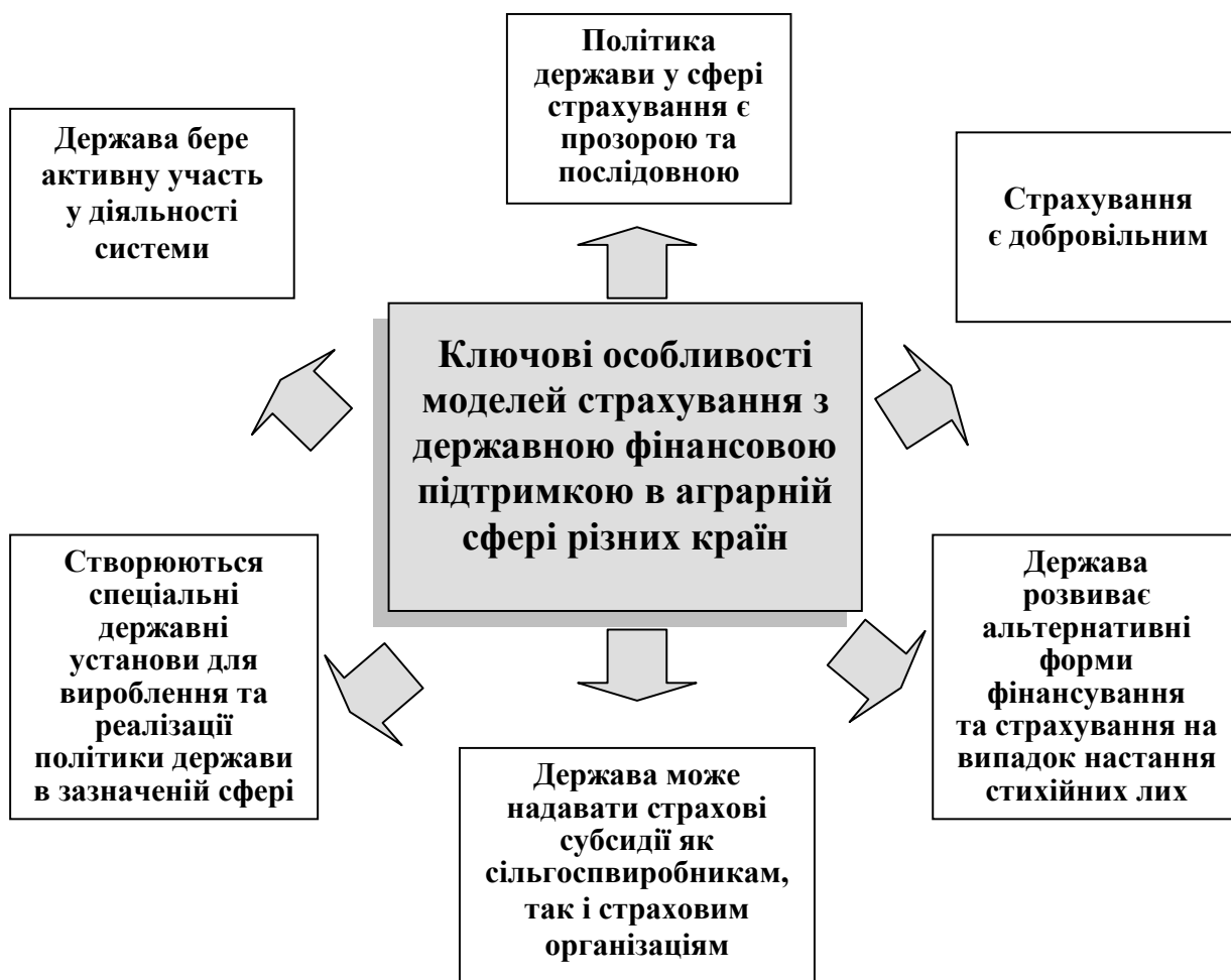
Рис. 3. Особливості моделей страхування з державною фінансовою підтримкою в аграрній сфері в різних країнах

Отже, ключові особливості моделей страхування з державною фінансовою підтримкою в аграрній сфері в різних країнах згруповано на рис. 3.