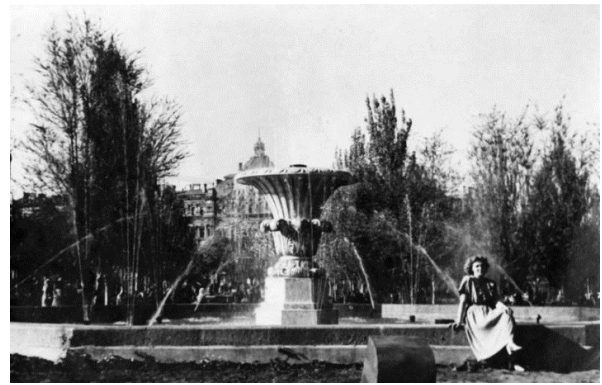
Рис. 9. «Ваза Філатова» на Соборній площі, 1936 р. Фото 1950-х років [12].