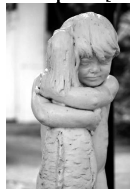
Рис. 11. Фонтан «Хлопчик з рибою», Маразліївська, 14А. 2024 р.

Хлопчик виступає символом чистоти, риба в його руках – уособлення багатств природи, морської стихії. Разом вони несуть ідею гармонії людини та природи, людини та моря.