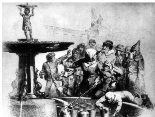
Рис. 4. Архітектурно-художній декор 1-го фонтану в Одесі. 1870-ті роки [12].

Чаша на символічному рівні є елементом зберігання самого цінного. В даному випадку для Одеси головна цінність – це сама вода. З різних боків чашу підтримують три великі риби, які нагадують за виглядом дельфінів. Дельфін – це символ швидкості, грайливості та бурхливості морської стихії. Для Одеси, яка будувалась, як морське торгове місто, це дуже символічно. Хлопчик виступав символом невинності та чистоти, як і вода, яку він обережно ніби то подавав мешканцям Одеси [4, 5].