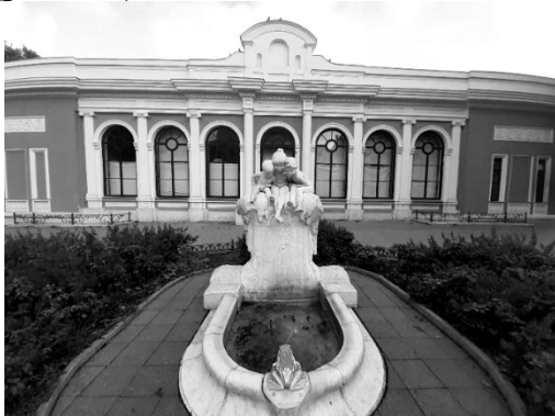
Рис. 12. Фонтан «Діти з жабою» («Молодість») на Театральній площі, 1905–1907 рр. Скульптор Макс Блонд. Фото автора 2020 р.

Одна із найвідоміших та найестетичніших пам'яток монументального мистецтва в центрі Одеси, фонтан «Молодість», є однією з замовних копій скульптурної композиції французького скульптора епохи модерну Макса Блонда (рис. 12).