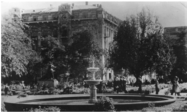
Рис. 10. Фонтан в Міському саду, 1875 р. [13].