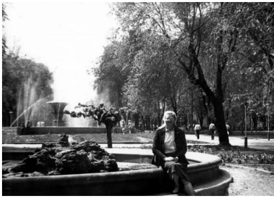
Рис. 8. 1-й фонтан та «фонтан Філатова» [12].