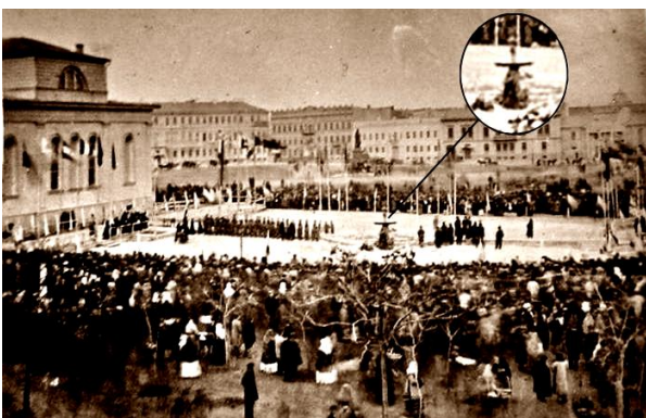
Рис. 2. Освячення одеського водопроводу та відкриття 1-го фонтану на Соборній площі в 1873 році [5].

22 вересня 1873 року на Соборній площі міста Одеси відбулося урочисте відкриття водопроводу та першого у місті фонтану (рис. 2) [3].