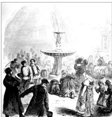
Рис. 3. Гравюра Г. Бролінга. Забезпечення жителів Одеси водою з 1-го фонтану на Соборній площі. 1870-ті роки [12].

Спочатку після запуску водопроводу фонтан, який став окрасою міста, ще і забезпечував жителів центра міста водою (рис. 3) [7]. Однак незабаром, з розвитку водопроводу, ця функція відпала [3]. Фонтан представляв собою велику кам'яну чашу, головним акцентом якої була статуя хлопчика, що тримав у руках чашу з водою (рис. 4) [7].