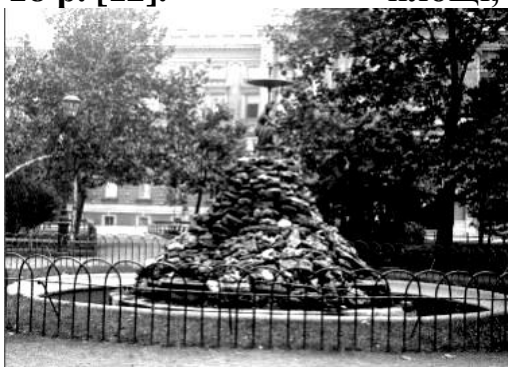
Рис. 7. Фонтан «Німфа» в Пале Роялі [5].

У 1940 році завдяки заступництву академіка (тоді ще професора) В. П. Філатова на його гроші було побудовано фонтан з великою мармуровою вазою у вигляді квітки, названий пізніше «вазою Філатова» [3]. На мові символів квітка – це образ надії, краси та швидкоплинності життя. І водночас у формі квітки виконана саме ваза – символ збереження цієї бездоганної краси та надії на кращі часи. На рис. 8 [7] на фото 1950-х років ми можемо побачити обидва фонтани. В 2001 році в результаті реконструкції Спасо-Преображенського собору було прийнято рішення замінити перший фонтан Одеси «вазою Філатова», яка розташовувалася в той час на місці колишнього вітваря (рис. 9) [7]. Образ чаши, досить популярний в Одесі і не тільки, можна було спостерігати і в фонтані в Міському саду (рис. 10) [8].