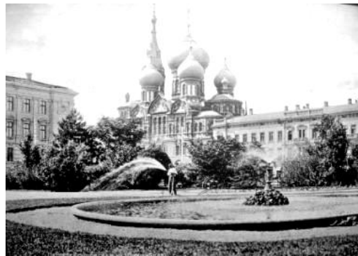
Рис. 6. Фонтан на Привокзальній площі, 1890-ті роки [5].