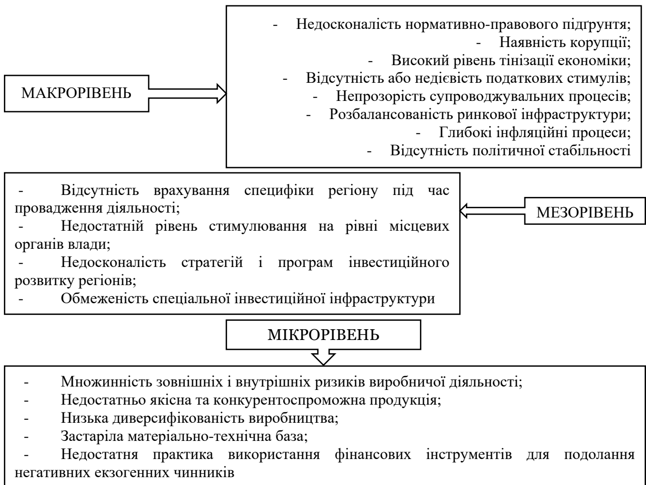
Рис. 1. Проблемні аспекти інвестиційної активності в аграрному секторі економіки України за рівнями економічної діяльності

Слід наголосити, що інвестиційна активність характеризується висхідними показниками також у тих сферах діяльності, які схильні до оновлення виробництва та впровадження інновацій. Згідно даних Державної статистичної служби України, витрати на інновації у галузі «Виробництво харчових продуктів, напоїв і тютюнових виробів» у 2022 році склали 8,3 % від загального обсягу за всіма галузями, причому за рахунок власних коштів підприємств – 1156,5 млн грн або 99,3 % від здійсненого обсягу. У тому ж 2022 р. обсяги капітальних інвестицій у сільське господарство України склали 51439,4 млн грн або 0,1 % від загальнодержавного показника (рис. 2).