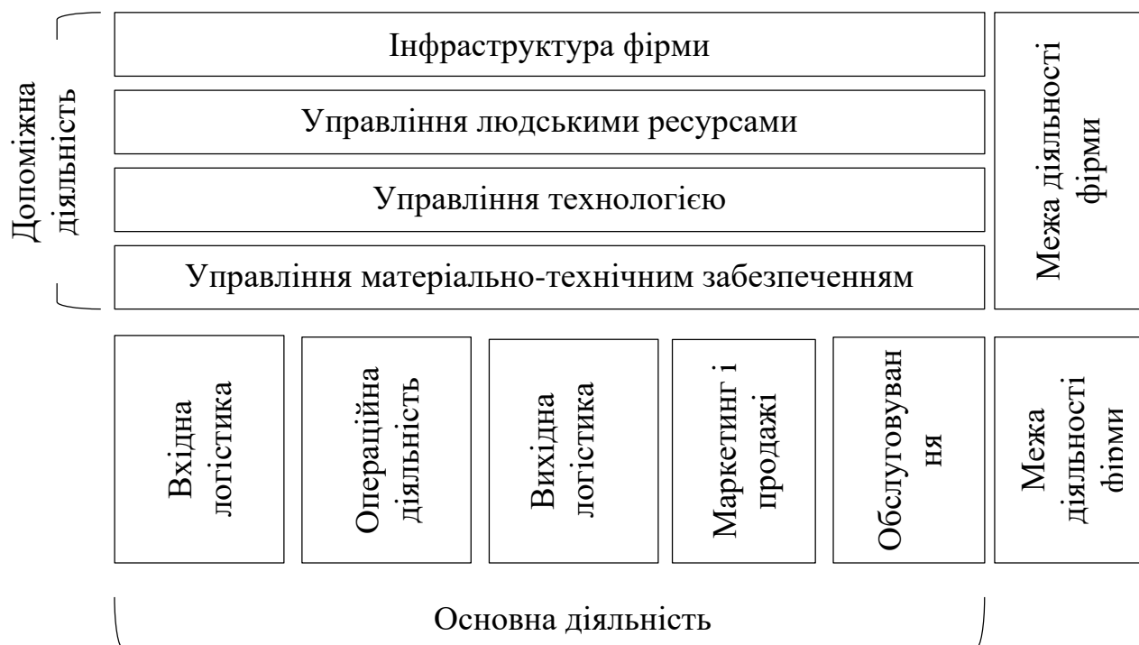
Рис. 1. Ланцюг вартості Майкла Портера [17]

Маркетинг і продажі. Діяльність, пов'язана з інформуванням потенційних покупців про продукти та послуги фірми, та спонуканням їх до цього шляхом особистого продажу, реклами та просування тощо [19].