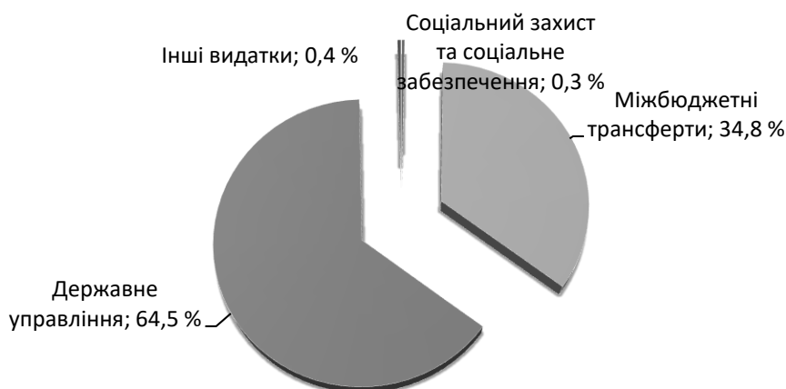
Рис. 1. Структура фактичних видатків загального бюджету Уманського району за 2021 рік, %

Проаналізувано структуру фактичних видатків загального бюджету Уманського району за 2021 р. (рис. 1).