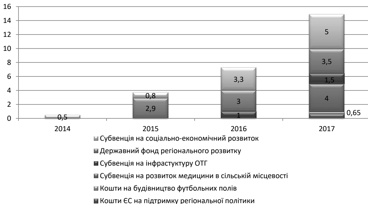
Рис. 3. Структура державної фінансової підтримки на розвиток громад та розбудову інфраструктури за 2014-2017 рр, млрд грн

Можна зазначити, держава відіграє певну роль у забезпеченні фінансової підтримки ОТГ, тому проаналізовано структуру державної фінансової допомоги на розвиток громад (рис. 3).