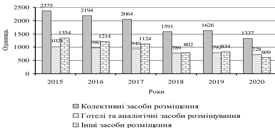
Рис. 1. Динаміка чисельності колективних засобів розміщування (юридичні особи) в Україні у 2015-2020 рр.

Аналіз динаміки розвитку колективних засобів розміщування (юридичні особи) в Україні засвідчив, що їх кількість за 2015–2020 рр. зменшилась на 1038 од. (або на 43,7 %) і на кінець 2020 р. становила 1337 од. (рис. 1, табл. 2).