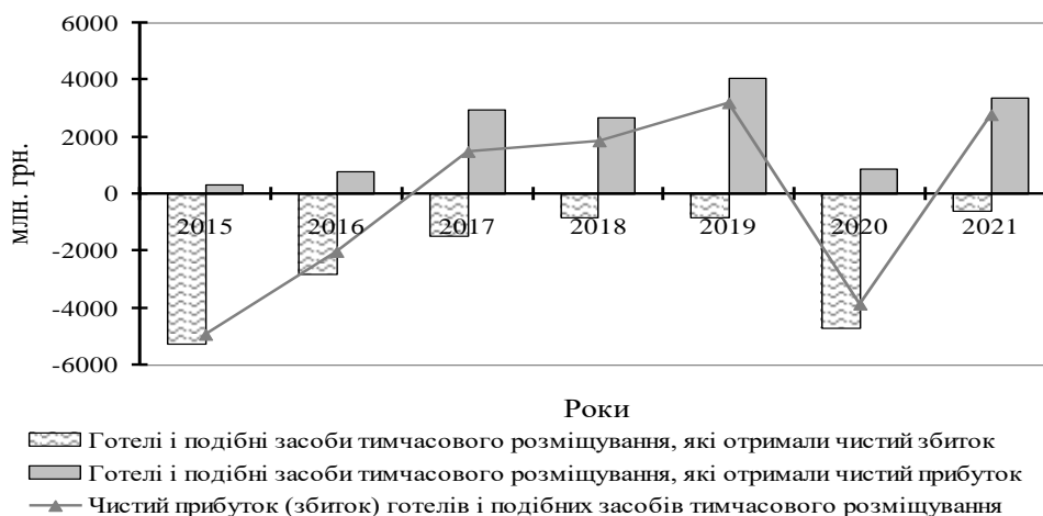
Рис. 3. Чистий прибуток (збиток) готелів і подібних засобів тимчасового розміщування України за 2015-2021 рр.

Чистий прибуток (сальдо) готелів і подібних засобів тимчасового розміщування у 2021 р. порівняно з 2015 р. збільшився на 7719,4 млн. грн. і на кінець 2021 р. становив 2760,3 млн. грн. (рис. 3).