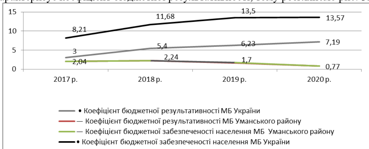
Рис. 3. Коефіцієнт бюджетної результативності місцевих бюджетів Уманського району і України

Рівень забезпеченості фінансовими ресурсами на душу населення характеризує коефіцієнт бюджетної результативності, тому розглянемо рис. 3.