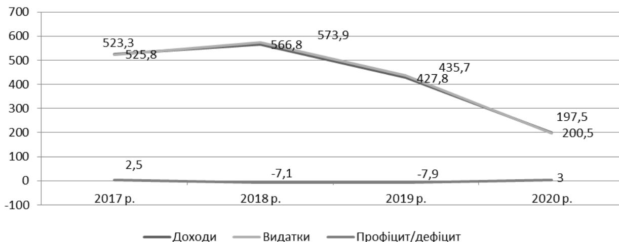
Рис. 2. Динаміка дефіциту/профіциту місцевих бюджетів Уманського району за 2017-2020 рр., млн грн

Джерело: авторські розрахунки за даними [2, 3].