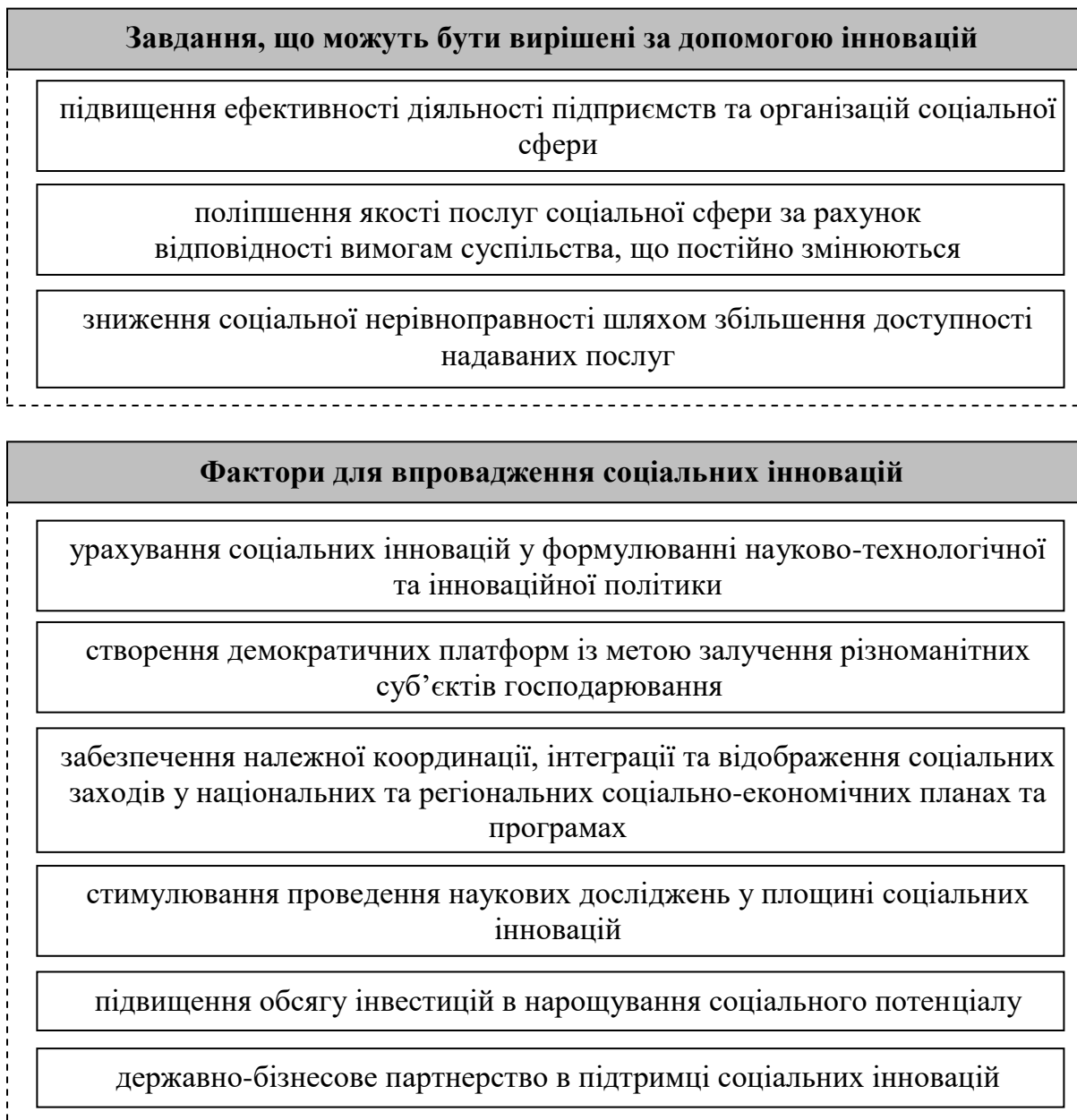
Рис. 4. Ключові фактори спрямування соціальних інновацій для досягнення економічного та соціального добробуту

інновації є необхідними, оскільки вони покращують якість життя населення. Значна кількість найважливіших соціальних викликів сучасності потребує радикальних інновацій, що перетинають організаційні, галузеві та дисциплінарні межі. При цьому сфера соціальних інновацій в Україні досі перебуває у зародковому стані, тільки починаючи виходити за межі локального застосування. Зважаючи на це, варто звернути увагу на фактори, які є ключовими для спрямування соціальних інновацій у напрямі досягнення економічного та соціального добробуту (рис. 4).