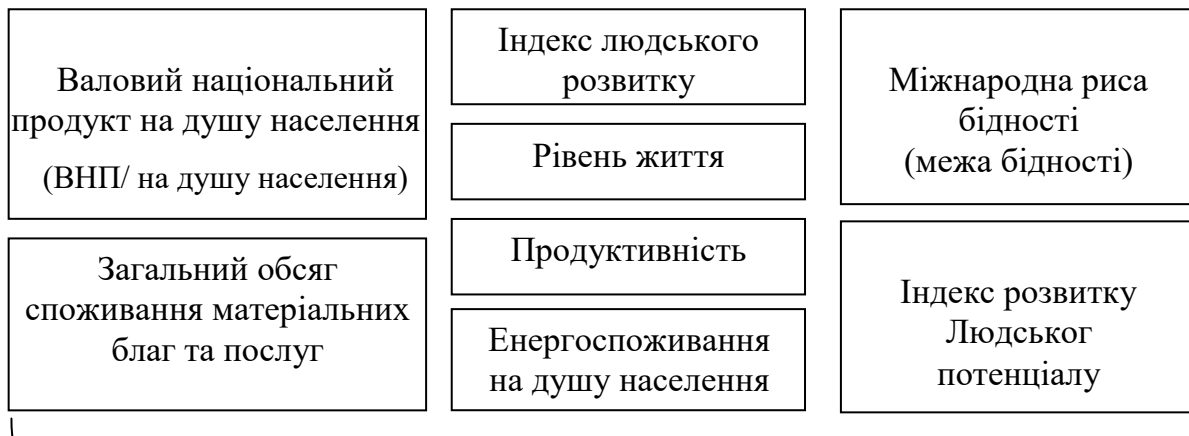
Рис. 1. Показники якості життя населення

Авторське узагальнення на основі джерел: [2, 6].