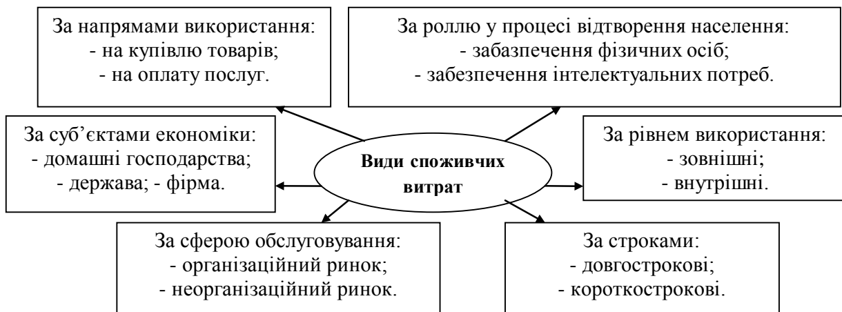
Рис. 1. Групування споживчих витрат за видами

Аналіз економічної літератури західних і вітчизняних економістів дозволяє нам відзначити, що в даний час переважає точка зору, відповідно до якої на процес споживчих витрат впливає наступна сукупність факторів: поточний дохід, накопичене багатство, очікування, споживча заборгованість, процентні ставки, податки й ін.